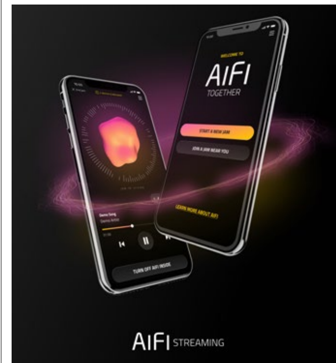
Under kvartalet lanserade Sound Dimension den nya tjänsten AiFi Streaming, inriktad på leverantörer av streamingtjänster