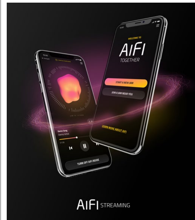
Sound Dimensions nya tjänst AiFi Streaming är inriktad på leverantörer av streamingtjänster