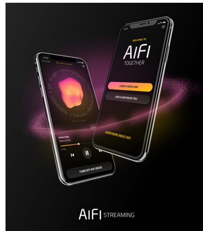
Sound Dimensions nya tjänst AiFi Streaming är inriktad på leverantörer av streamingtjänster